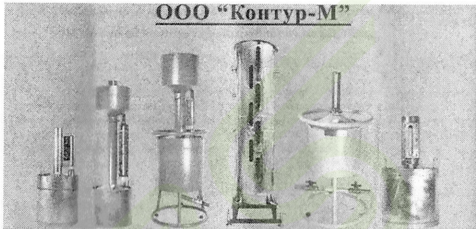
Мерники 1-го разряда